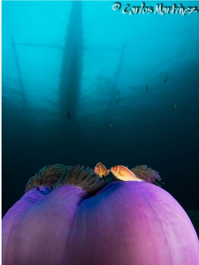
Un gran angular, aunque no me convence mucho... he decidido ponerlo.