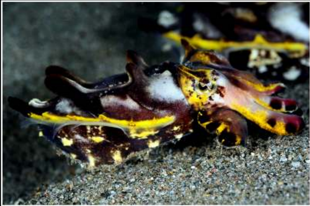
ISO: 100, velocidad: 1/100s, diafragma: f:10, distancia focal: 105 mm, fecha: 22/11/2011