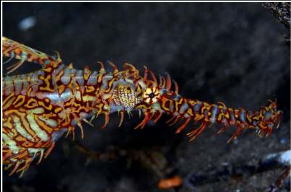
ISO: 100, velocidad: 1/100s, diafragma: f:11, distancia focal: 105 mm, fecha: 22/11/2011