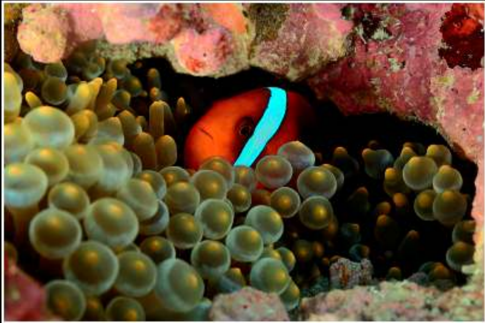
ISO: 100, velocidad: 1/100s, diafragma: f:11, distancia focal: 70 mm (17-70), fecha: 23/11/2011