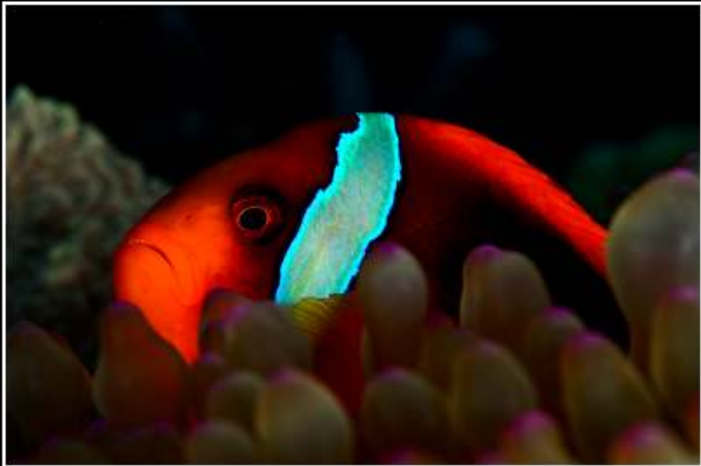
ISO: 100, velocidad: 1/100s, diafragma: f:18, distancia focal: 60 mm (17-70), fecha: 22/11/2011