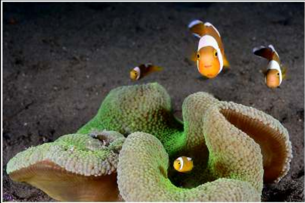
ISO: 100, velocidad: 1/100s, diafragma: f:10, distancia focal: 45 mm (17-70), fecha: 21/11/2011 07:18