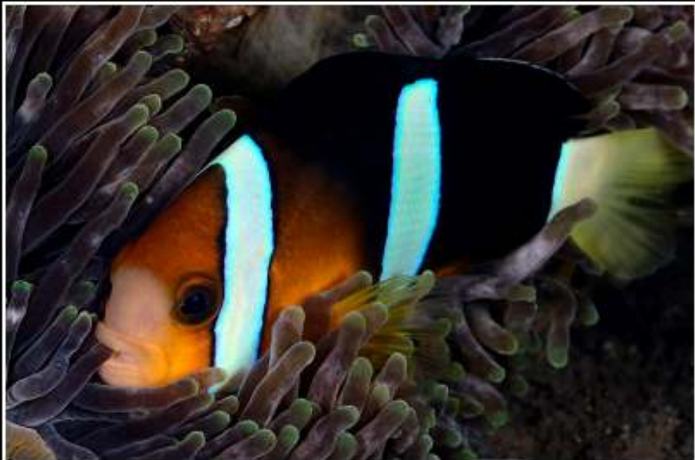
ISO: 100, velocidad: 1/100s, diafragma: f:18, distancia focal: 60 mm, fecha: 24/11/2011